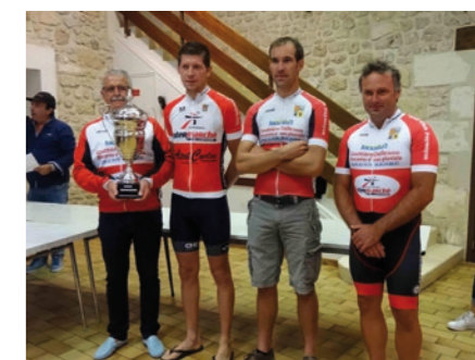
Sur les courses, les Rouges et Blancs mouillent le maillot avec de belles places à la clé.

Toute personne, fille ou garçon, désirant intégrer une structure