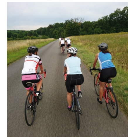
Depuis plus d'un an, la section féminine accueille une dizaine de licenciées.

dynamique pour pratiquer le cyclisme en loisir ou en compétition sera la bienvenue au Cyclo Club de Puymoyen.