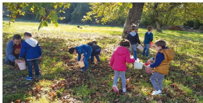
Les Fripouilles ramassent les noix

De leur côté, les Fripouilles ont rencontré M.Trufandier, nuciculteur bio à Vouzan. Ils ont vu les différentes étapes de ramassage et de tri des noix, impressionnés par le travail des machines. Ils ont ensuite été invités à un goûter composé de sablés et de gâteaux aux noix. Ils ont pu rapporter leur récolte et préparer un excellent gâteau pour le goûter, partagé avec les copains des autres groupes.