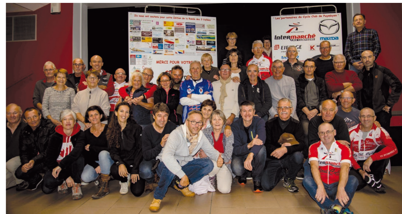
Les bénévoles du Cyclo Club se retrouvent toujours avec le sourire.

Plus d'infos sur le site internet du club : www.ccpuymoyen.com