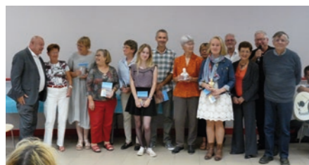
Remise de prix du concours de nouvelles