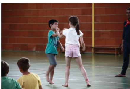
Découverte du karaté

Lors de ces 4 semaines, tous sont allés à Nautilus, ont participé à des ateliers cuisine, des grands jeux, chasses au trésor, initiation danse, karaté ou kayak... proposés par les animateurs.