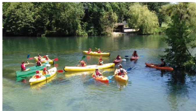
Découverte du kayak pour les Chupas

Après 3 semaines de vacances, nous nous sommes retrouvés fin août. Au programme : sortie piscine, jeux sportifs, ateliers cuisine, activités manuelles... pour préparer la reprise en douceur !