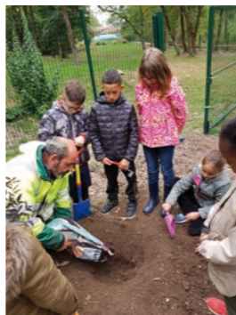
Plantations des Scoubidoues