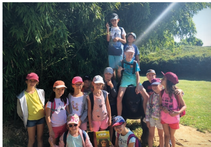
Journée à la Vallée des singes

Cet été, 123 enfants sont partis en « voyage autour du monde ». La première escale était le continent africain. Les enfants se sont initiés à la danse, aux percussions corporelles et ont fabriqué des bracelets. Tous ont passé une belle journée à la Vallée des singes et se sont régalés avec les cornes de gazelles fabriquées lors d'un atelier cuisine.