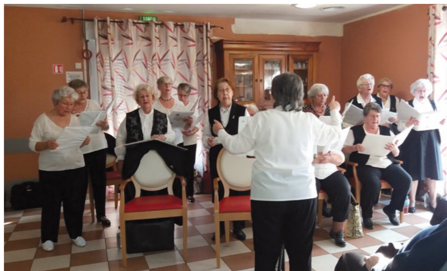
Chorale Le chant des Eaux Claires : 05 45 61 15 98

En attendant ce moment, nous vous souhaitons nos meilleurs vœux pour 2019. À bientôt dans nos rangs.