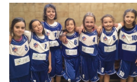
Les U11 (la Blue Girl Team)

Une belle saison en perspective avec de nombreux projets pour le club de votre commune qui, nous le rappelons, n'est géré que par des bénévoles (bureau et encadrement technique).