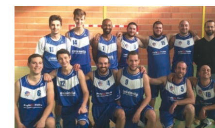
Équipes séniors garçons 1 et 2

Nous sommes toujours à la recherche de nouveau membre !