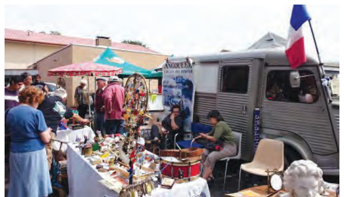
Traditionnel Bric à Brac