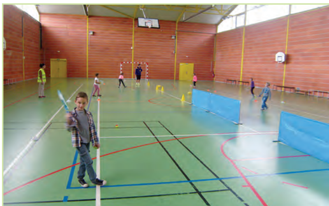
Activité Tennis lors des temps d'activités périscolaires