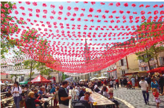
Félibrée à Verteillac, Dimanche 29 Juin

Dimanche 29 Juin : Félibrée à Verteillac. Ville très bien décorée, où se pressaient beaucoup de gens, costumés ou non. C'était la fête, malgré une ou deux averses. Le soir traditionnelle pause à la salle des Fêtes de Combiers et retour à Angoulême.