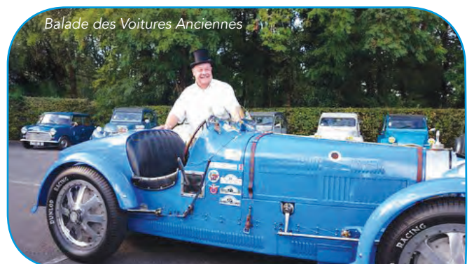
Balade des Voitures Anciennes