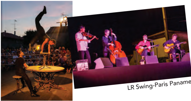
LR Swing-Paris Paname

Nous avons pu vivre une soirée très agréable où le temps a été notre allié ; tout d'abord par le groupe Tango Sumo composé de trois hommes, un ring alternant bancs et cordages, un arbitre improbable jouant de l'accordéon et un décor tourné vers lui-même.