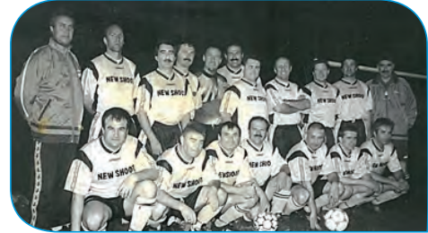
L'équipe du départ de l'AFV Puymoyen à la fin des Années 90

« Il est des temps que les moins de 20 ans... »