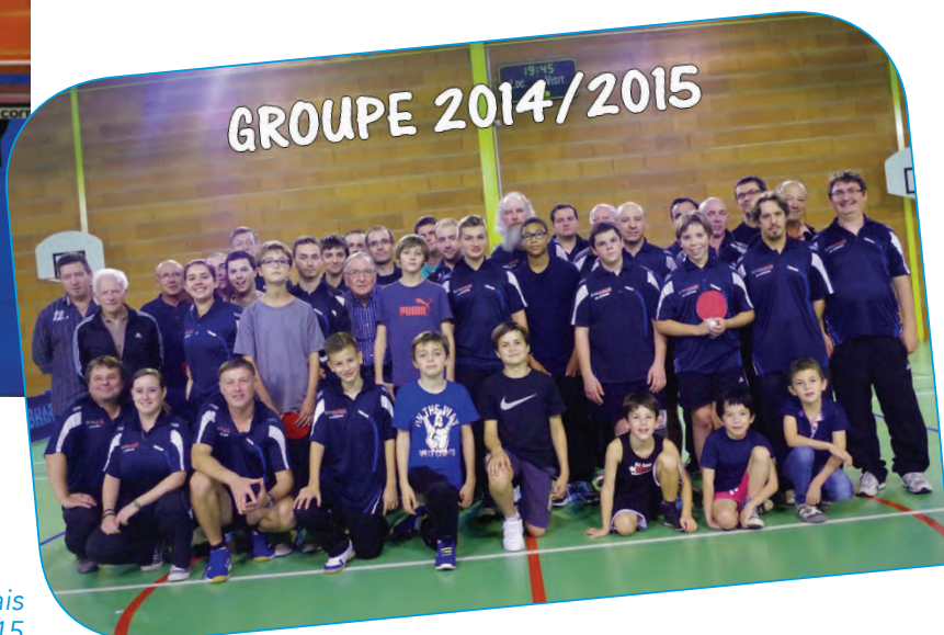
Le groupe Puymoyennais 2014/2015