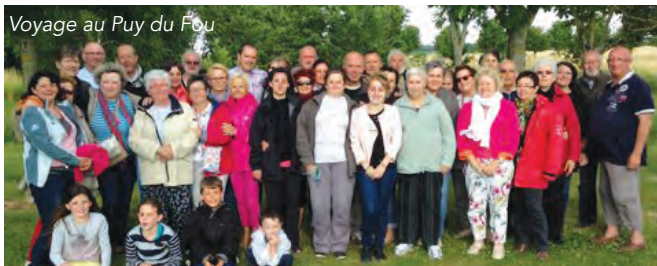
Voyage au Puy du Fou

Les 29 & 30 juin 2014, le Comité des Fêtes a organisé un voyage au Puy du Fou. Cela a permis à la cinquantaine de participants de vivre deux jours, sous la pluie, au rythme des chevaliers, du monde imaginaire de Jean de la Fontaine et de grands personnages historiques lors des spectacles grandioses tels que le Secret de la lance, les mousquetaires de Richelieu, le bal des oiseaux fantômes ou encore le spectacle nocturne, ce qui a suscité beaucoup d'admiration et d'émotion.