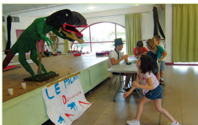
Centre de Loisirs