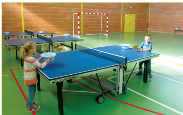
Activité Ping-Pong lors des temps d'activités périscolaires