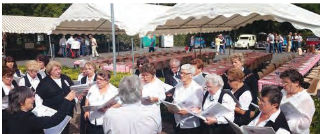
27 e Foire aux Vins - Chorale des Eaux Claires

La restauration rapide sous le chapiteau a connu un vif succès grâce à la présence de nouveaux