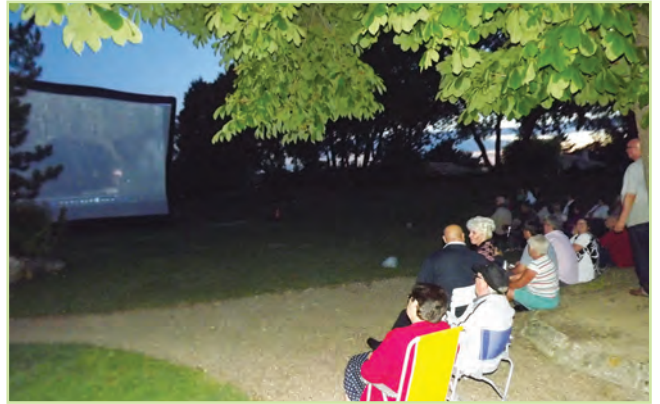
Cinéma plein air