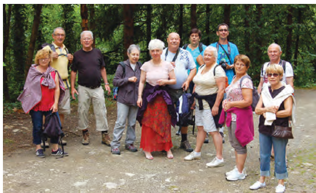
Voyage en Aubrac

La nouvelle saison 2014-2015, s'avère encore très intéressante en fonction du programme proposé, sans oublier les aléas de l'actualité avec les diverses éruptions potentielles (dont bon nombre sont suivies actuellement de très près au sein du groupe).